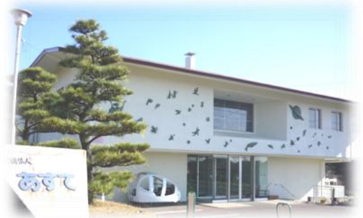
The view of Aste (the front entrance)