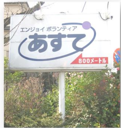
↑ Aste's signboard